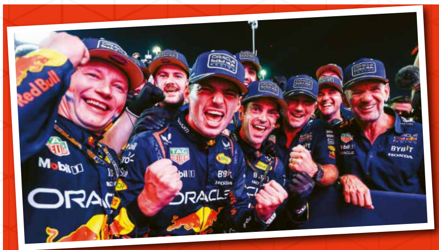
Boven Max Verstappen verpulvert de concurrentie in 2023 en eindigt 290 punten voor Sergio Pérez.

Lando Norris werd in 2025 kampioen na een strijd tussen drie coureurs die het hele seizoen duurde. Hij pakte de titel met een derde plaats in de laatste van 24 GP's, in Abu Dhabi, waarmee hij Max Verstappen met twee punten versloeg. Hoewel titels al met kleinere marges zijn beslist, scoorde Verstappen, gecorrigeerd voor de puntentelling na 2010, met 99,52 procent van Norris' punten, het hoogste percentage voor plek twee.