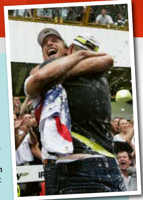
Boven Jenson Button is een van de tien Britse wereldkampioenen.

Met tien rijders die samen twintig titels wonnen, zijn de Britten het meest succesvol in de Formule 1-historie. Zeven titels waren voor Lewis Hamilton, drie voor Sir Jackie Stewart, twee voor Graham Hill en Jim Clark, en een voor Mike Hawthorn, John Surtees, James Hunt, Nigel Mansell, Damon Hill en Jenson Button. Duitsland volgt met twaalf titels – zeven voor Michael Schumacher, vier voor Sebastian Vettel en een voor Nico Rosberg – en Brazilië is derde met acht titels.