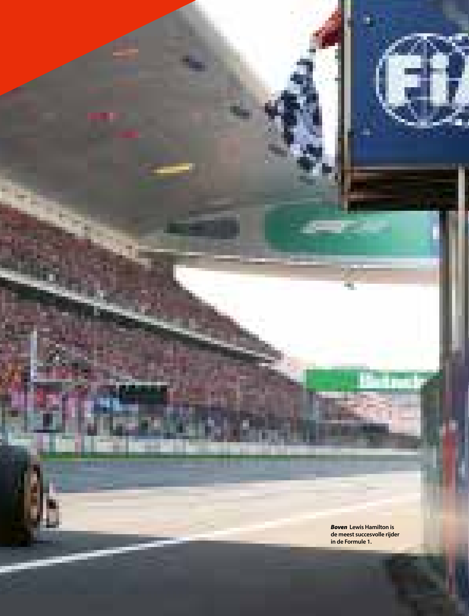
Boven Lewis Hamilton is de meest succesvolle rijder in de Formule 1.