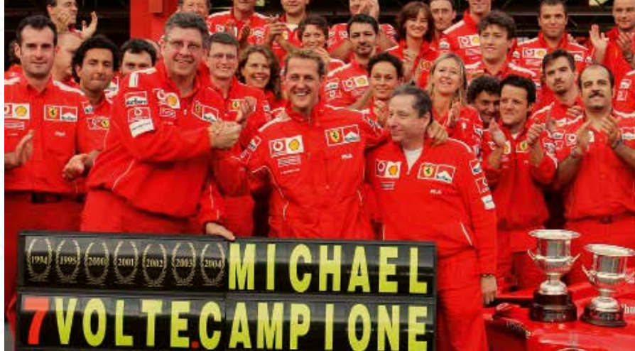
Boven Michael Schumacher domineerde de eerste helft van de jaren 2000 en won vijf wereldtitels op rij.